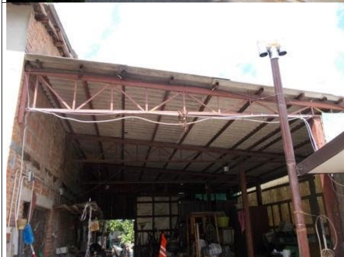
MIR CA 23 (2)