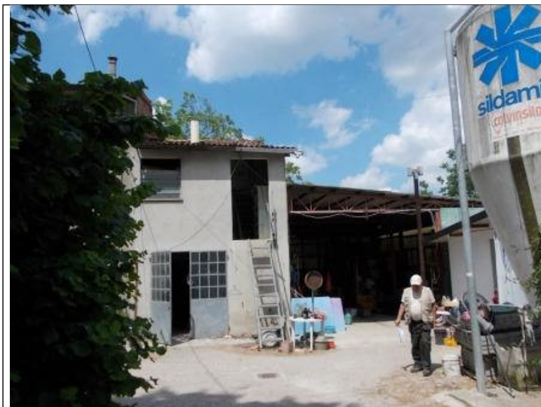
MIR CA 23 (1)