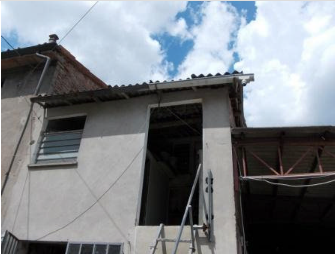
MIR CA 23 (3)