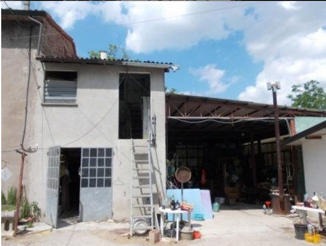
MIR CA 23 (4)